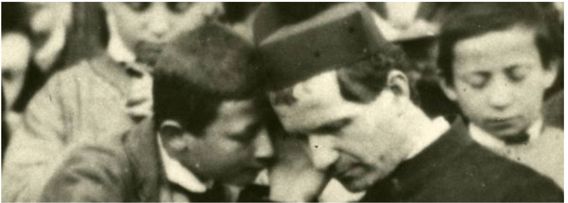
EQUIPO INSPECTORIAL DE PASTORAL JUVENIL